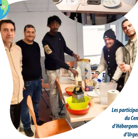
Les participants du Centre d'Hébergement d'Urgence