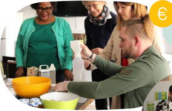
Les participants de la Résidence Accueil

...de plus, 1 litre de lessive maison représente un coût de revient de moins de 50 centimes !