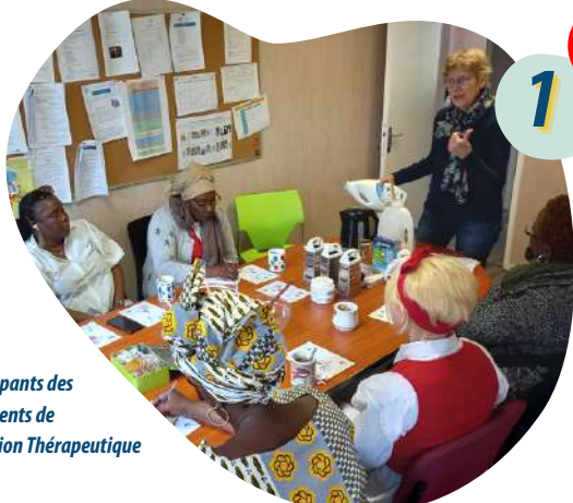
Les participants des Appartements de Coordination Thérapeutique

Fabriquer sa lessive soi-même, est un avantage pour :